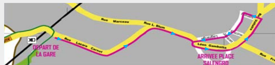
Parcours du défilé

Petits et grands, venez partager un moment convivial avec nos associations qui nous ont promis des chars hauts en couleurs et en musique, et rejoignez-les en centre-ville à 23H00 pour admirer le feu d'artifice !