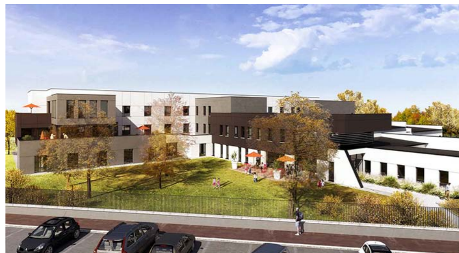
Projet de l'établissement sur deux étages