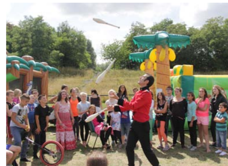
Du lundi 27 au vendredi 31 juillet Leforest-Land Nos Quartiers d'Été