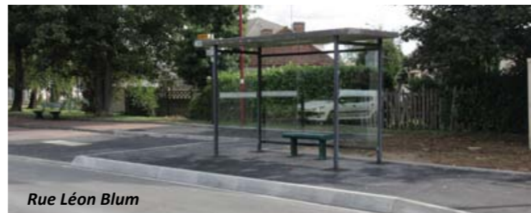
Rue Léon Blum

Les quais des arrêts du centre ville et de la rue Léon Blum ont été mis aux normes cet été afin de simplifier l'accès au bus aux personnes âgées et à mobilité réduite. Coût de l'opération : 9 800 €. Rehaussés, ils permettent aux fauteuils et poussettes d'entrer plus aisément au sein des bus, leur pente adoucie facilitant quant à elle l'accès aux quais. Les abris bus ont également été changés.