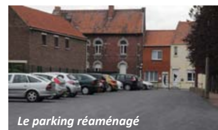
Le parking réaménagé