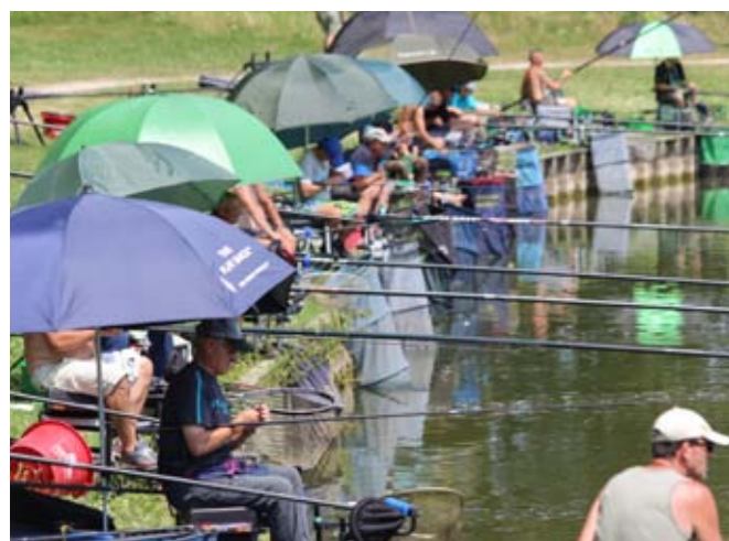
Samedi 4 juillet Concours de pêche des Amis du Plan d'Eau