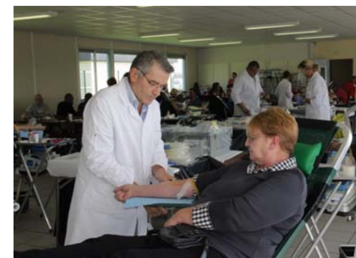
Dimanche 30 août Don du sang avec les Donneurs de Sang