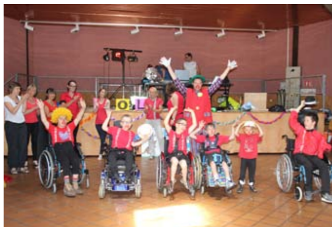
Samedi 4 juillet Kermesse des Cyclades