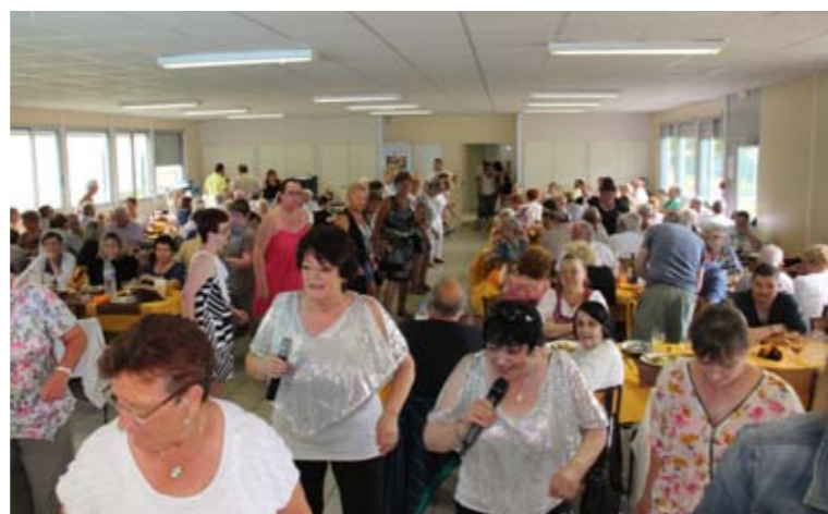
Samedi 4 et dimanche 5 juillet Week-end en fête du Comité des Fêtes du Planty