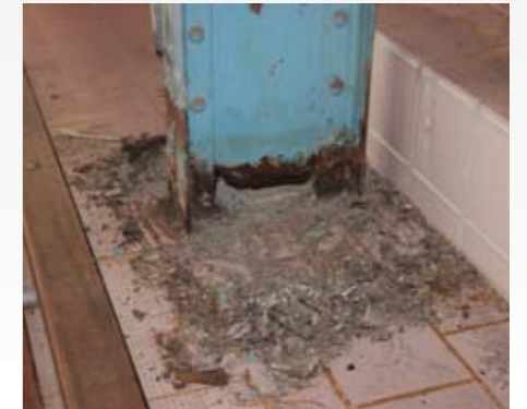
L'état des piliers porteurs

minuer les consommations d'eau et d'améliorer le confort des usagers.