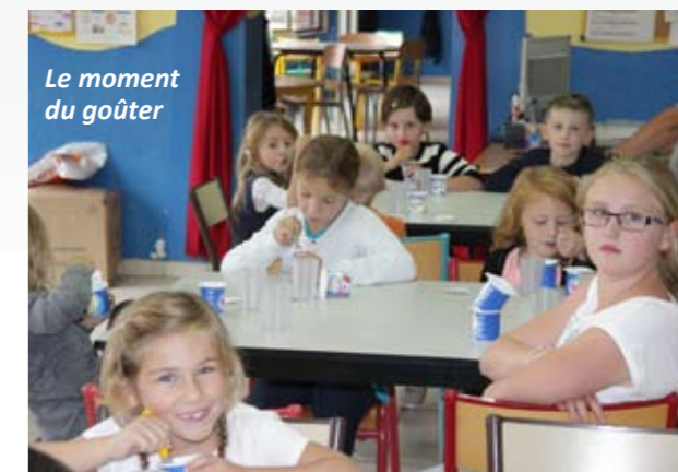
Le moment du goûter

A compter du lundi 2 novembre 2015, la garderie « 1, 2, 3 Soleil » déménage à l'arrière de la médiathèque, dans un local flambant neuf qui a obtenu récemment son autorisation d'ouverture.