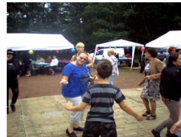
Dimanche 26 juillet Guinguette des Enfants du Bois