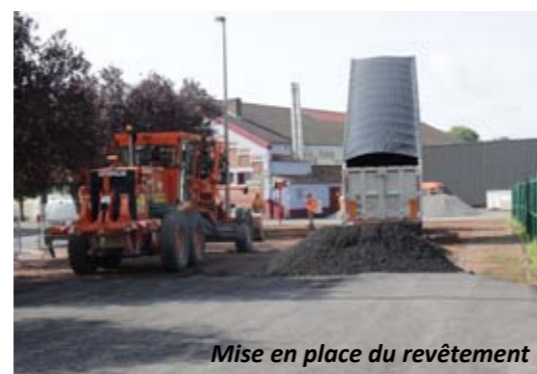
Mise en place du revêtement