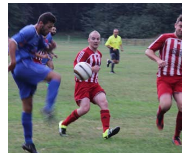
Samedi 15 et dimanche 16 août Tournoi David Langrenez de l'A.E. Football Club