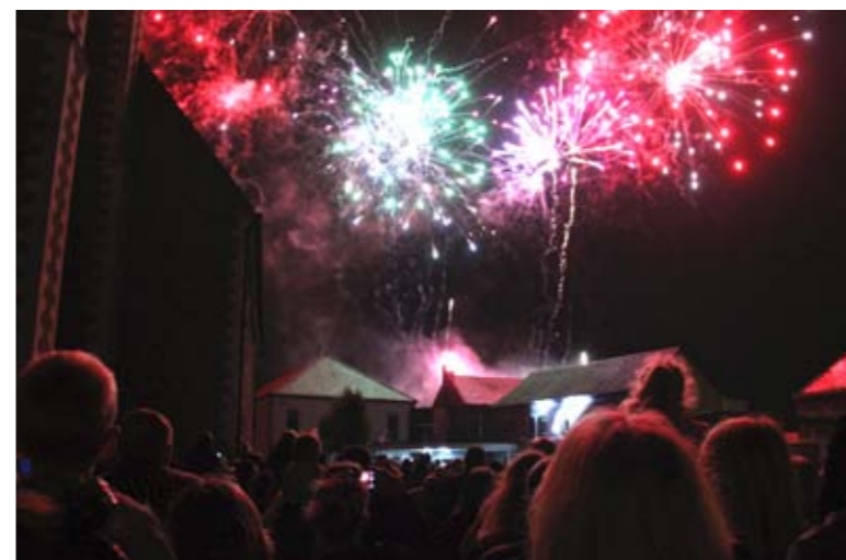
Lundi 13 juillet Défilé et feu d'artifice Place Salengro