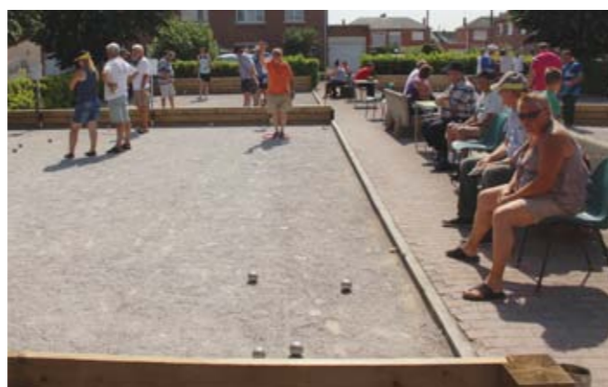
Samedi 11 juillet Concours de Paradis Pétanque