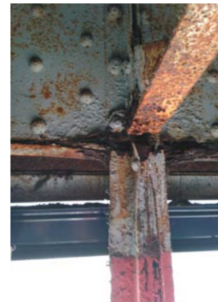
L'état de la charpente métallique

Un diagnostic a donc été lancé courant juin, qui a révélé dans les combles, sous l'isolant, une bien mauvaise surprise : la corrosion importante de la charpente. Il a donc été décidé fin juin, par mesure de précaution, de fermer l'établissement afin de pousser un peu plus loin l'étude de la structure du bâtiment et notamment des poteaux porteurs.