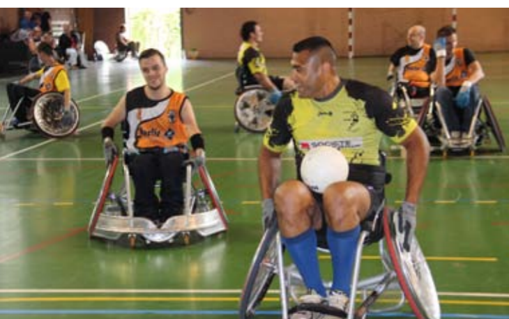
Dimanche 5 juillet Match handisport de l'A.E.E.P Leforest Rugby