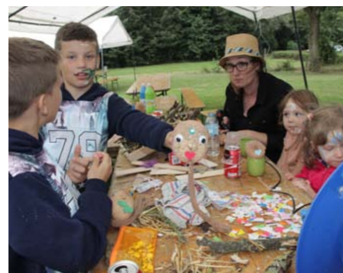
Dimanche 23 août Après-midi récréatif des Enfants du Bois