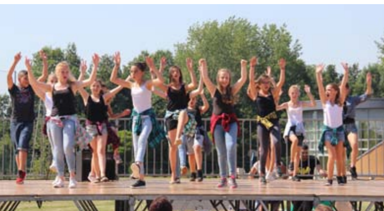
Mercredi 1 er juillet Première fête de fin d'année du collège Paul Duez