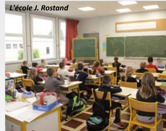
L'école J. Rostand

cipales, la restauration des classes de Rostand, par la réalisation d'une salle témoin : isolation, éclairage, électricité et peinture, pour une classe refaite à neuf, avec un coût de 10 500 €. Au fur et à mesure des vacances scolaires, cette réfection se poursuivra par d'autres classes, pour améliorer les conditions d'accueil de nos élèves.