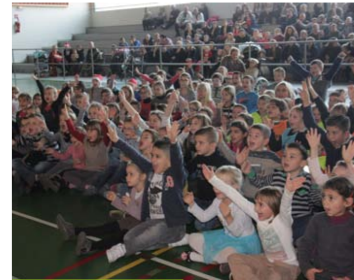
Mercredi 23 décembre Noël inter-associatif avec spectacle et goûter pour les enfants