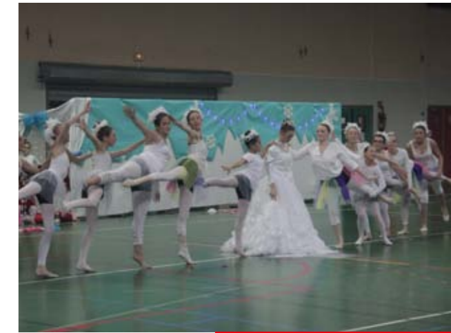
Dimanche 13 décembre Gala d'Évasion GR