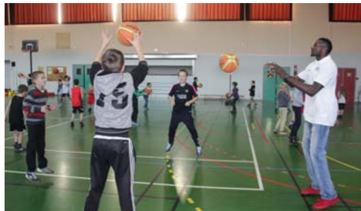
Mercredi 18 novembre Initiation au basket avec des joueurs pro de l'équipe d'Orchies