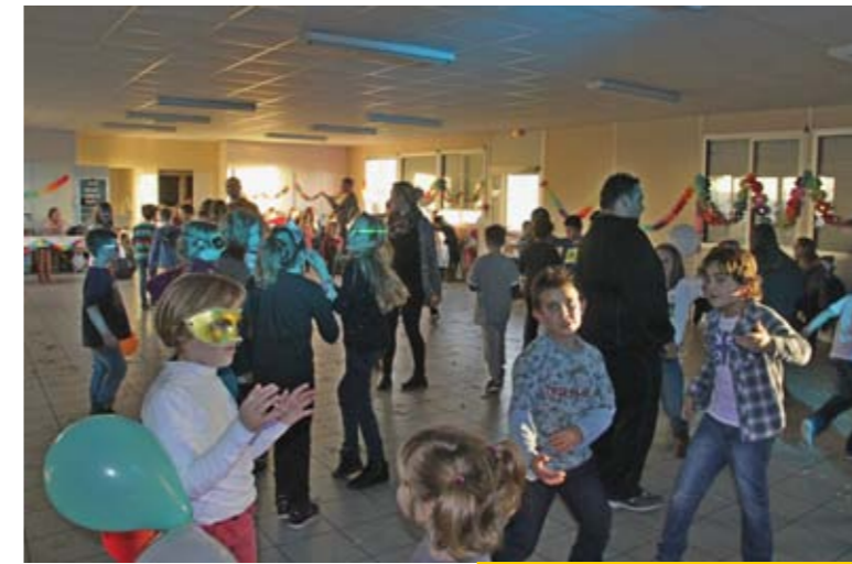
Dimanche 13 décembre Boum pour les 6-12 ans du Comité des Fêtes du Planty