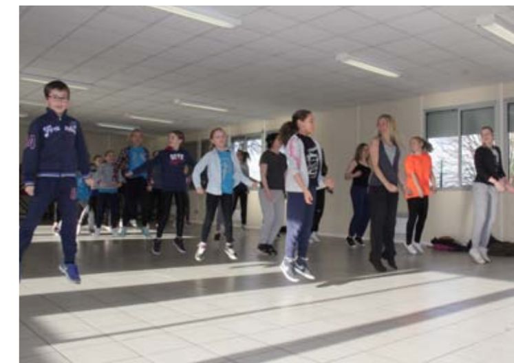
Samedi 16 janvier Stage de Hip Hop avec Horizons Loisirs Jeunes