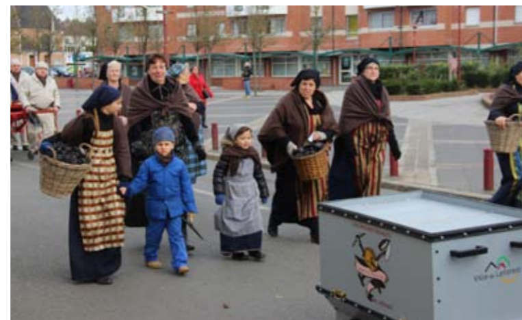
Samedi 5 décembre Cérémonie de Ste Barbe des Anciens Mineurs de Leforest