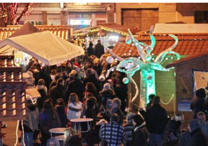
Samedi 28 et Dimanche 29 novembre Marché de Noël Place Salengro