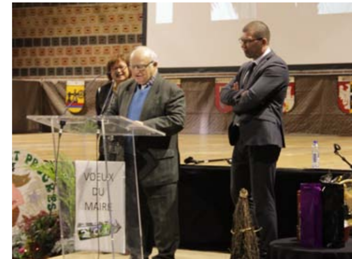
Dimanche 10 janvier Cérémonie des vœux à la population