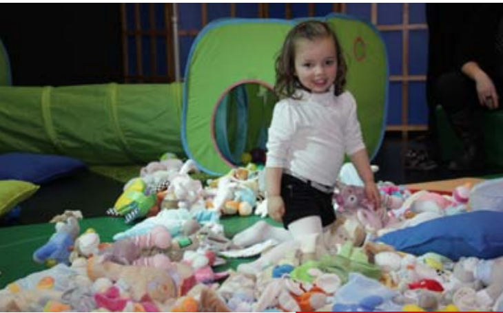
Samedi 7 novembre Atelier doudou à la Médiathèque