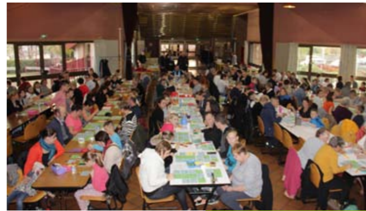
Dimanche 8 novembre Loto d'Au Bonheur des Jeunes Leforestois