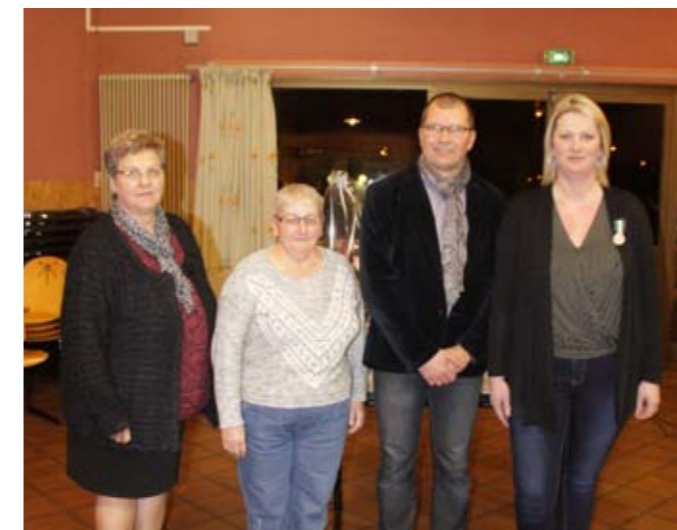
Vendredi 15 janvier Cérémonie des vœux au personnel communal