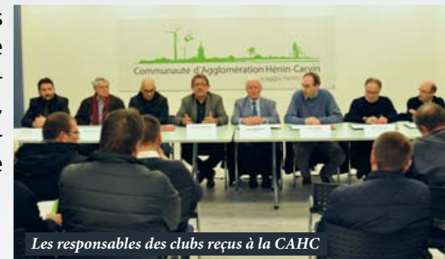
Les responsables des clubs reçus à la CAHC