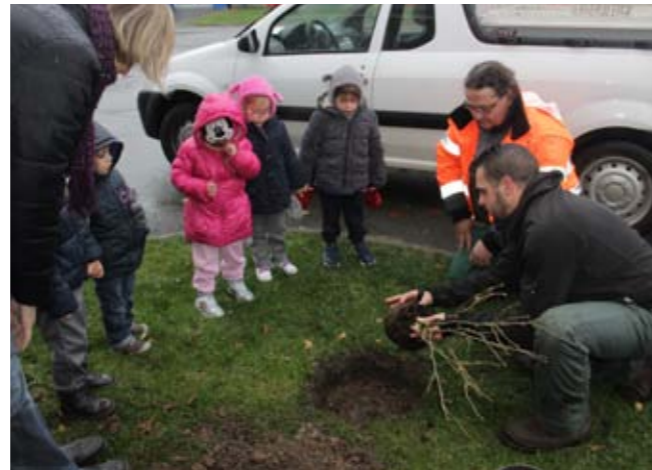
Du 21 au 28 novembre Festival de l'arbre Plantations pédagogiques dans les écoles